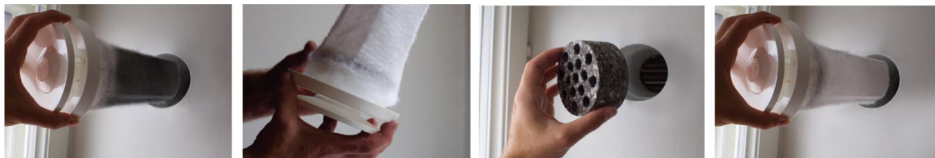
A készlethez hangcsillapító kizárólag a \varnothing 100 mm-es modell esetén jár.

Helyezzük vissza a légbevezetőt oda, ahol volt. Amennyiben szükséges, finoman szorítsuk a fali átvezető csőbe, így biztosan fog rögzülni. Ezután a fenti módon állítsuk be a fali légbevezetőt.